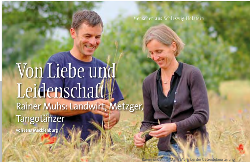
Menschen aus Schleswig-Holstein